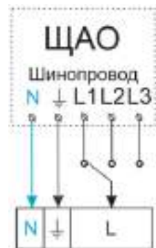
Рис. 1 - Схема подключения